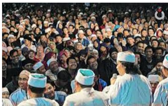
Gambar 1 – Komunitas Maiyah

Komunitas Maiyah juga memiliki identitas yang kuat dalam hal cinta ilmu. Dalam setiap pertemuan, tema diskusi dipilih berdasarkan isu-isu sosial dan dibahas melalui berbagai perspektif ilmiah dan budaya. Anggota komunitas didorong untuk terus belajar, berbagi pengetahuan, dan memperdalam pemahaman mereka tentang dunia, baik dari sudut pandang agama maupun keilmuan modern. Selain aspek spiritual dan intelektual, komunitas Maiyah menanamkan cinta tanah air sebagai bagian dari identitasnya. Dalam berbagai kegiatan, terutama yang berkaitan dengan isu-isu sosial, perspektif kebangsaan selalu menjadi perhatian utama. Kegiatan Maiyah secara aktif mendorong anggotanya untuk peduli pada perkembangan sosial dan menjaga persatuan bangsa. Maiyah juga dikenal dengan pendekatan budayanya yang kuat. Dalam kegiatan mereka, kebudayaan seperti musik tradisional (gamelan) dan seni teater sering digunakan sebagai bagian dari dakwah. Hal ini menunjukkan bagaimana komunitas Maiyah memadukan agama dan kebudayaan lokal untuk menyampaikan nilai-nilai Islam secara damai dan kreatif.