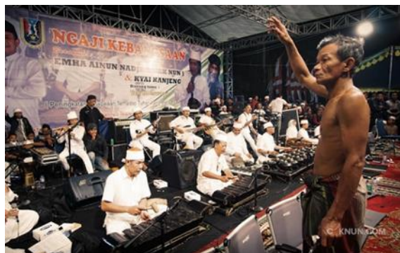
Gambar 4 – Grup Muski Kiai Kanjeng

Komunitas Maiyah Kenduri Cinta seringkali membawakan aspek kesenian di pertengahan forumnya untuk meningkatkan emosi audiens dan menjadi tanda bahwa Maiyah Kenduri Cinta tidak hanya sekadar forum diskusi belaka, melainkan tempat untuk melestarikan kesenian yang ada di Indonesia. Kiai Kanjeng adalah salah satu grup musik produk budaya maiyah yang sering ditampilkan saat forum Kenduri Cinta berlangsung.