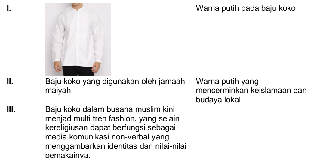
Tabel 3. Analisis Semiotik Roland Barthes Baju Koko