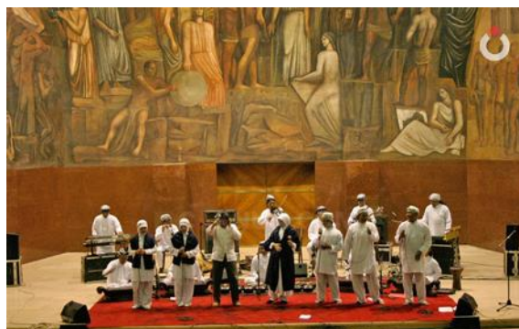
Gambar 5 – Kegiatan Toleransi Komunitas Maiyah

Kegiatan utama Maiyah, seperti pengajian rutin di berbagai kota di Indonesia (Jakarta, Yogyakarta, Semarang, Jombang, Surabaya), menjadi wadah untuk diskusi, pemahaman, dan penerapan nilai-nilai keagamaan. Maiyah menekankan pentingnya kebersamaan lintas agama dan budaya, serta aktif dalam mediasi konflik sosial-keagamaan, seperti kasus lumpur Lapindo dan deklarasi damai antara Islam, Yahudi, dan Kristen.