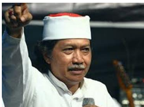
Gambar 6 – Profil Diri Cak Nun