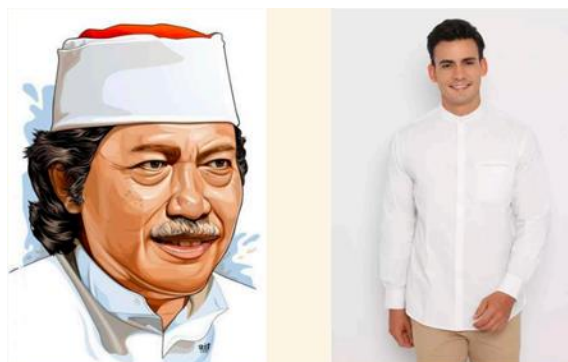
Gambar 3 – Kopyah dan Pakaian Putih

Maiyah Kenduri Cinta merupakan forum dengan identitas visual yang khas, dibuktikan dengan pakaian yang dikenakan oleh para penggiat dan audiensnya. Melalui tanda-tanda visual seperti pakaian, ekspresi, dan simbol-simbol budaya yang hadir dalam forum, kita dapat melihat bahwa identitas Maiyah tidak hanya berbicara tentang agama dalam konteks ritualistik, tetapi juga memadukan pemikiran-pemikiran universal dengan landasan moral yang kuat.